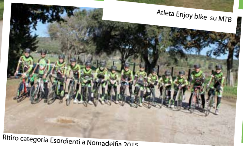
Ritiro categoria Esordienti a Nomadelfia 2015

Enjoy Bike asd collabora con la struttura ospedaliera Ni-guarda Cà Granda di Milano, settore AUS, con i ragazzi affetti da Spina Bifida con l'intento di fargli fare attività motoria e con l'obiettivo di riuscire a fargli svolgere le stesse attività dei ragazzi normodotati, con l'utilizzo di mezzi appropriati.