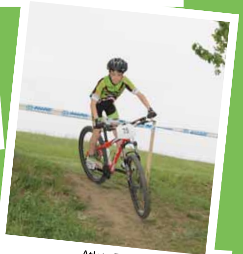
Atleta Enjoy bike su MTB