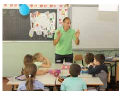
Gincana effettuata durante il progetto scuola 2015