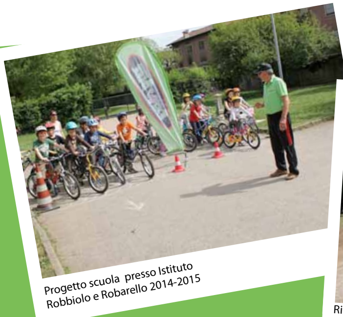
Progetto scuola presso Istituto Robbiolo e Robarello 2014-2015