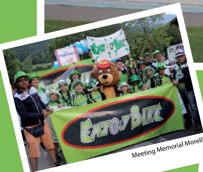
Meeting Memorial Morelli